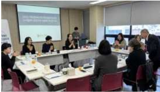
2025. 11. 11.(화) 회의