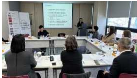
2025. 11. 12.(수) 회의