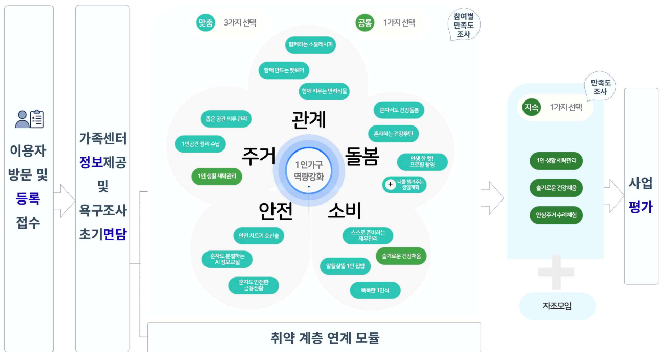
[가족센터 1인가구 역량강화 서비스 흐름도(안)]